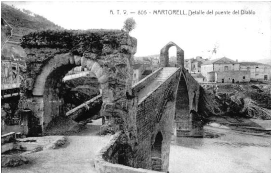
Vista del Pont del Diable amb l'edifici de la caserna al fons.

El 8 de gener de 1733 fou signada la venda perpètua dels terrenys on s'havia d'edificar la caserna, situats just davant de la capella de Sant Bartomeu i del Pont del Diable, pel preu de 120 sous.